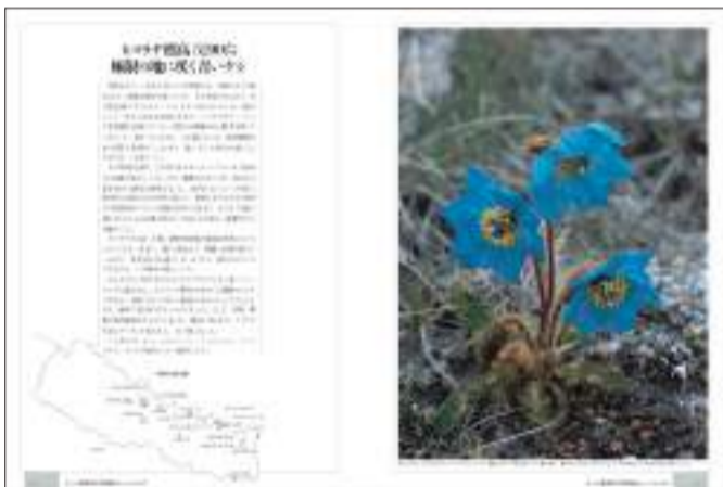
「青いケシ」が標高5200mに咲いていた

見開きいっぱいに展開される不思議な光景！植物の解説はもちろん、取材の顛末を描いたエッセイもふんだんに、図鑑や旅行記としても楽しめます。