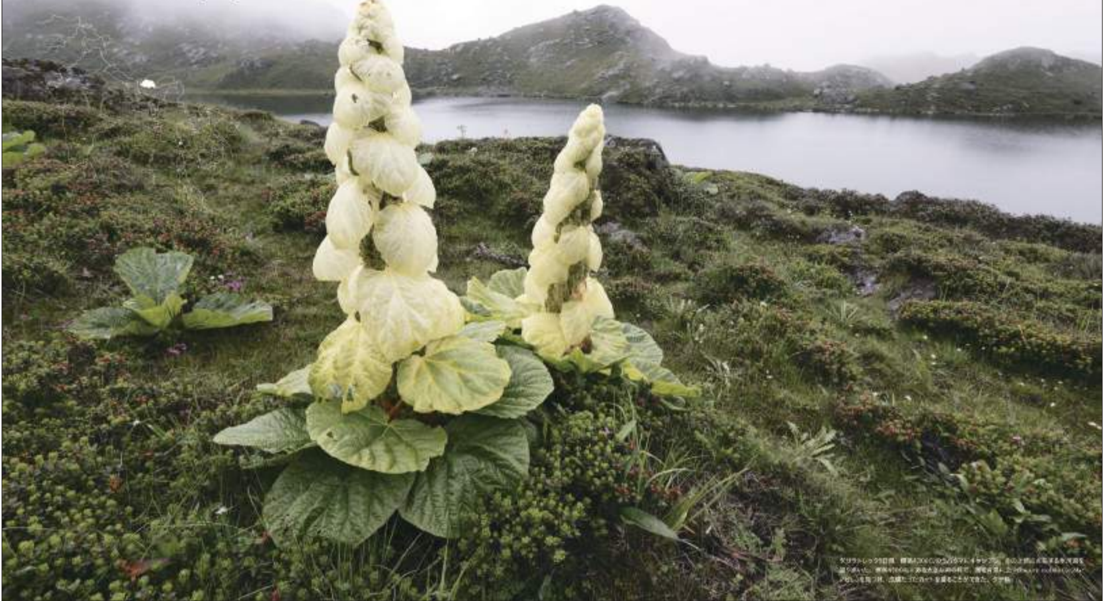
標高4500m、氷河湖畔に咲くレウム・ノビレ

見開きいっぱいに展開される不思議な光景！植物の解説はもちろん、取材の顛末を描いたエッセイもふんだんに、図鑑や旅行記としても楽しめます。