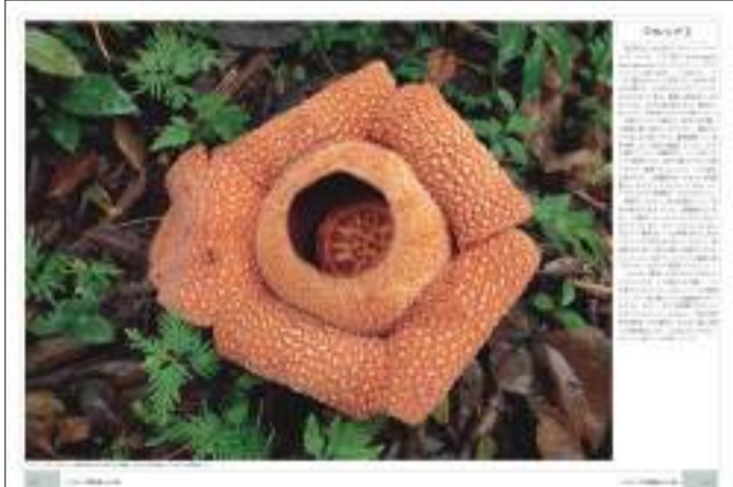
世界最大の花ラフレシア